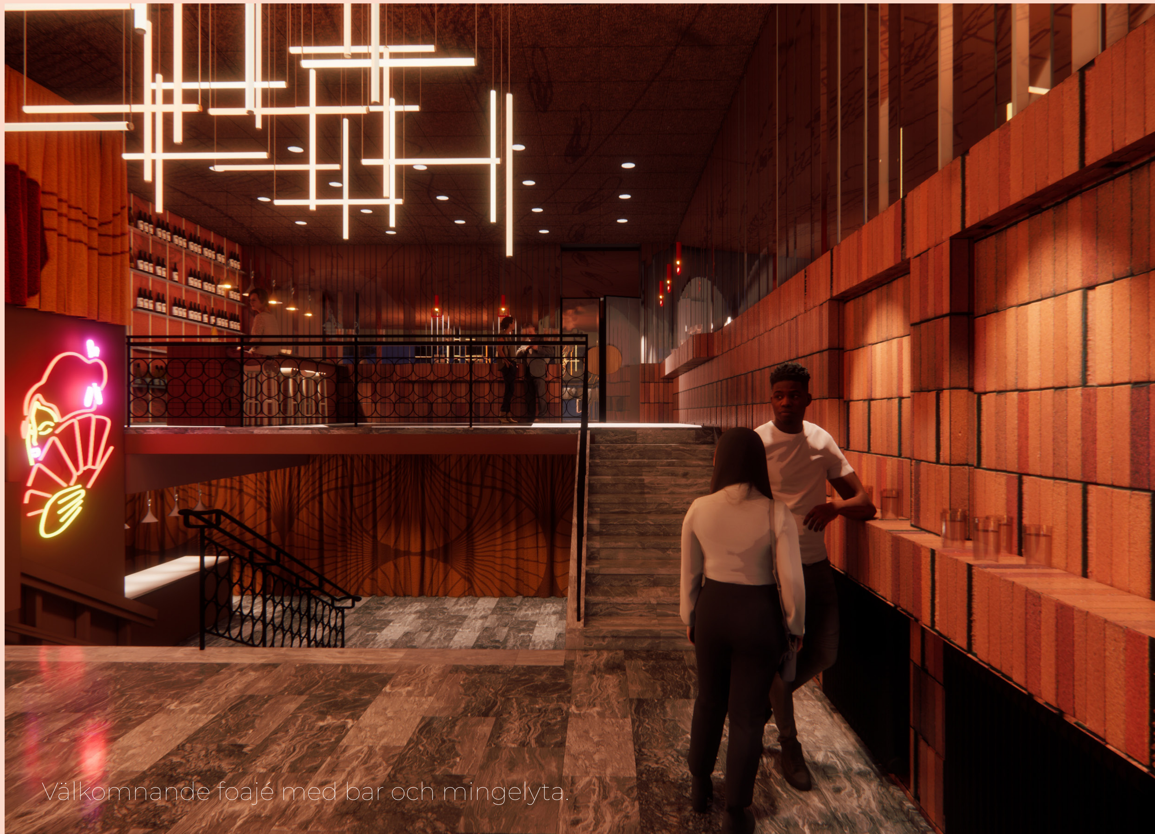
Välkomnande foajé med bar och mingelyta.